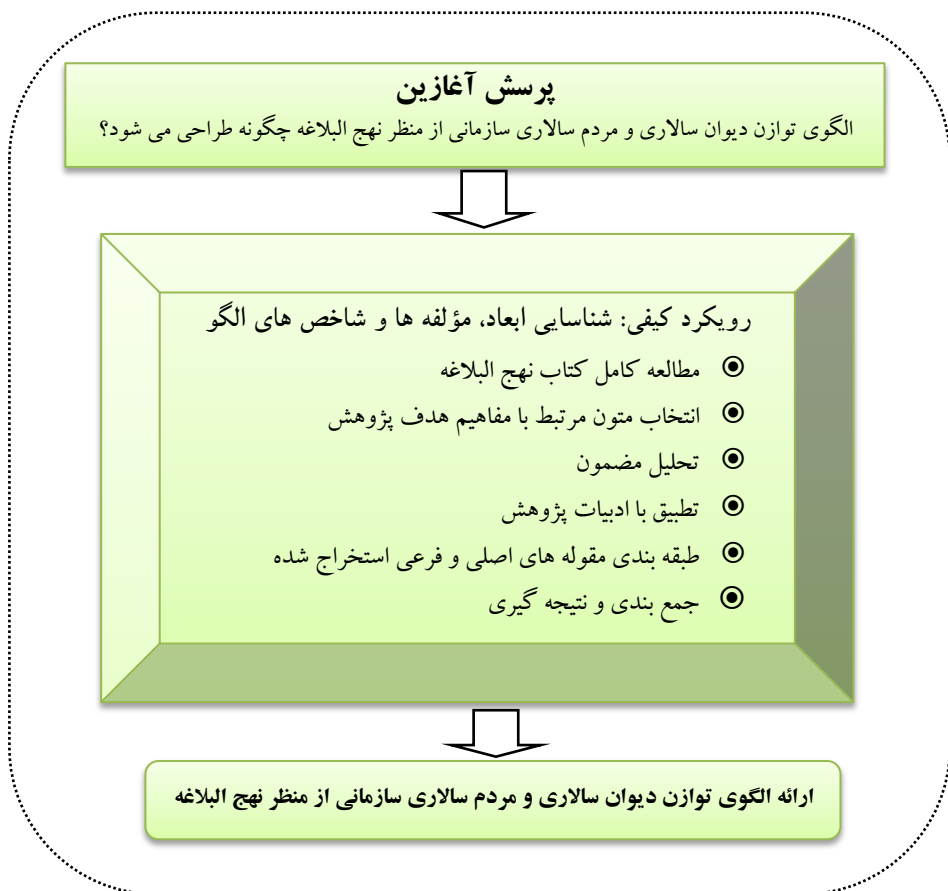
شکل ۱. مراحل انجام پژوهش

در این پژوهش با توجه به مطرح نمودن آن‌ها در پی ارائه الگویی است که بتواند در عین توجه به اصول بوروکراتیک به معیارهای مردم‌سالاری نیز در یک قاب یکپارچه توجه نماید و با ادغام آن با معیارهای اسلامی به یک الگوی نظام‌مند و چندبعدی از مدیریت اسلامی دست یابد. این الگو را می‌توان به بارزترین وجه در اصول مدیریتی و حکمرانی و شاخص‌های عملکردی و رفتاری امام علی (ع) از متون نهج‌البلاغه یافت که ضمن توجه به آن می‌تواند راهبردی برای ارتقای سطوح مدیریتی در کشور و نظام مقدس جمهوری اسلامی ایران باشد. در پژوهش حاضر پس از بررسی ادبیات پژوهش و ذهنیت اولیه از کلیت عوامل مربوطه، در چارچوب یک پژوهش کیفی مطابق با مراحل شکل زیر، فرایند انجام پژوهش صورت پذیرفت: