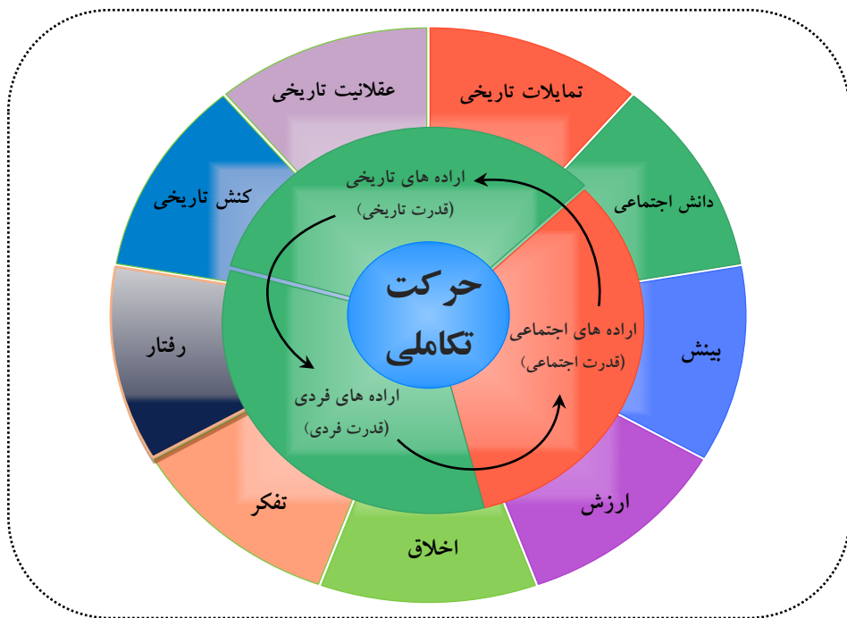
شکل شماره ۲. مکانیزم و سطوح حرکت تکاملی

و تکامل جوامع تحت سرپرستی خودشان را ارائه می‌کنند؛ تولی «قدرت اجتماعی» به‌عنوان محور هماهنگ‌کننده جامعه بر محور «ولی تاریخی» نیز مؤثرترین حرکت سازمانی در الحاق و اتصال شبکه اراده‌های اجتماعی به شبکه قدرت‌های تاریخی است (میرباقری، ۱۳۹۳، صص ۷۱-۸۸).