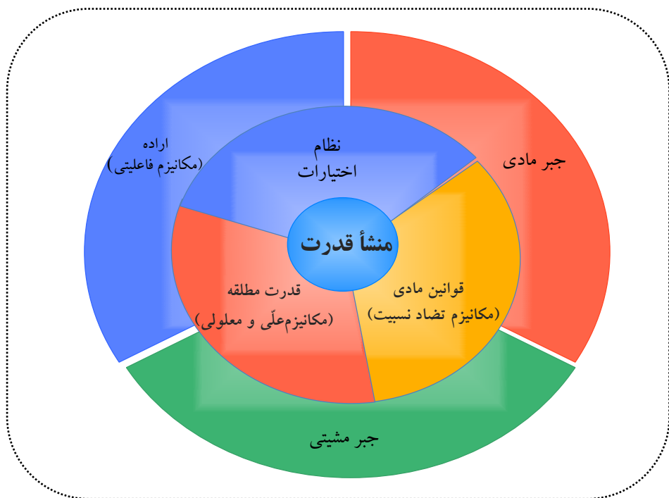
شکل شماره ۱. فرآیند شکل‌گیری قدرت