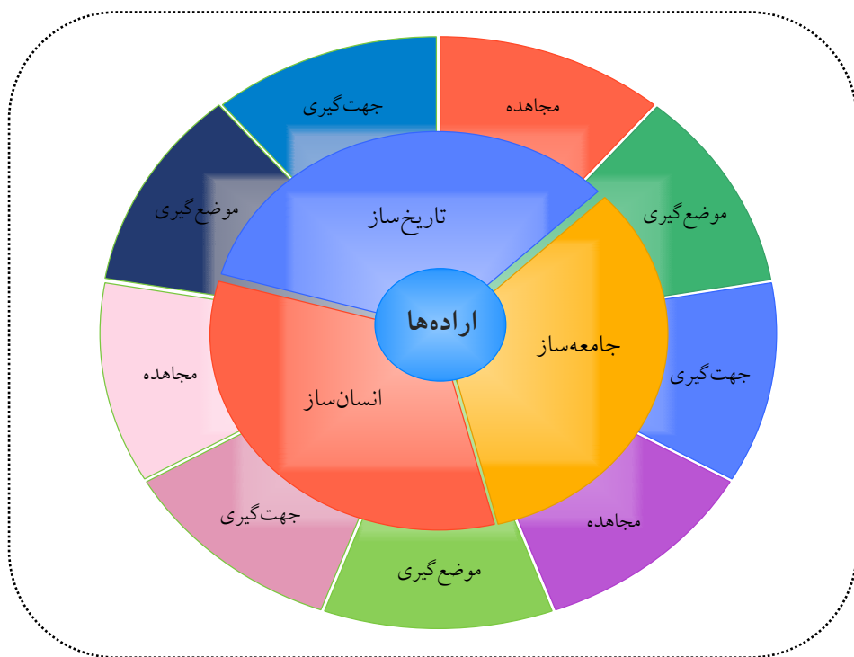
شکل شماره ۳. مقیاس و سطوح اراده‌ها

اراده‌های دسته اول؛ در عالم تمدن، سرپرستی تاریخی تمدن‌های را بر عهده‌دارند. این طیف اراده‌ها، «تاریخ‌ساز» می‌باشند و دارای قدرت جهت‌دهی کلان به تاریخ و ایجاد چشم‌انداز جدید برای عبور یک جامعه از یک مرحله تاریخی به مرحله دیگر است. این نوع از اراده‌ها در عالم مدرن، از منظر جامعه‌شناختی مدرن مربوط به شخصیت‌های کاریزماتیک می‌باشد که از قدرت رهبری تاریخی برخوردارند و در یک دوره‌ی طولانی، نفوذ اراده‌شان استمرار دارد. این اراده‌ها با تکیه بر ارزش‌های محوری و پذیرفته‌شده و با بهره‌مندی از عواطف و هیجانات جامعه، از قدرت کاریزماتیک خود برای ایجاد انقلاب بهره می‌گیرند. البته این طیف از اراده‌های تاریخ‌ساز را نمی‌توان صرفاً در شخصیت‌ها و قدرت‌های سیاسی منحصر کرد، بلکه در عرصه‌ی انقلاب علمی و فلسفی و اقتصادی نیز می‌توان شاهد بود. اراده‌های تاریخی، حرکت و تکامل تمدنی و تاریخی را زمینه‌سازی می‌کنند و شرایط پیدایش عالم جدید را فراهم می‌کنند (مرعشی، ۱۳۷۷، صص ۱۹۳-۱۹۵).