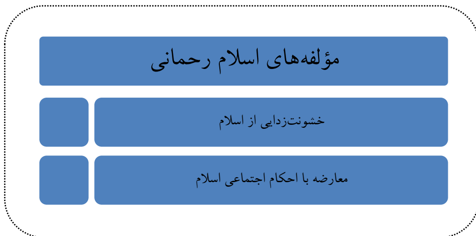
شکل ۲: مؤلفه‌های اسلام رحمانی

دانستن متون دینی و کمک گرفتن از پیش‌فرض‌ها برای تفسیر متن است، زیرا متن مانند طبیعت امر مبهمی است که چندین معنا در بر دارد، زیرا معنای واقعی وجود ندارد و معناهای درست متعدّد می‌توان داشت. بنابراین، پلورالیسم معرفتی که رکن اساسی اسلام رحمانی است. حق بودن دین واحد را مردود دانسته به حق‌های متعدّد باور دارد و به توجیه تعارض ادیان می‌پردازد (همان، صص ۳۴۸-۳۵۴) ایا امر به نسبت معرفتی می‌انجامد و انسان را در گردابی مبهم غرق می‌سازد.