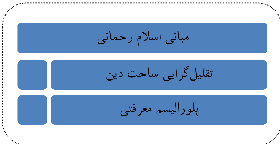
شکل ۳: مبانی اسلام رحمانی