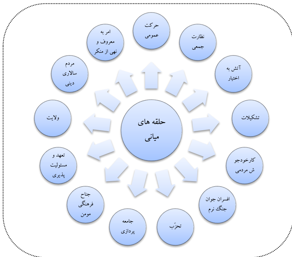
نمودار شماره ۲: شبکه‌ی مفهومی حلقه‌های میانی

در یک سیر تکوینی می‌توان مفهوم آتش‌به‌اختیار را هم در این بسته‌ی مفهومی تحلیل کرد؛ گذشت زمان و ساختارگرایی‌های افراطی سبب شد که نقش مردم در بسیاری از سطوح کمرنگ شود و موجب ایجاد یک نوع انسداد بین حاکمیت و توده‌ها شود، خلق مفهومی مانند آتش‌به‌اختیار تا حدودی رافع این انسداد و در واقع انفتاح این مسیر بود که البته با مفاهیم همسوی دیگر مسبوق به سابقه هم بود؛ مفاهیمی مانند کار خودجوش مردمی و جناح فرهنگی مؤمن یا افسران جنگ نرم یک نوع هویت‌سازی و برجسته‌نمایی نقش مردم مخصوصاً جوانان بود، نقشی که بدون ایفای آن بار انقلاب به منزل نمی‌رسد، هرچند حاکمیت از عهده‌ی تکالیف خود به‌خوبی برآید. (۶) (رهبر انقلاب، دیدار دانشجویی، ۹۴/۳/۱) چرا که انقلاب و تمدن‌سازی نیازمند یک حرکت عمومی و فراگیر است.