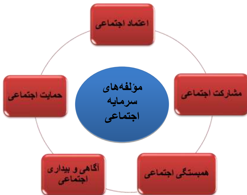
مدل شماره ۱

در ادبیات جامعه‌شناسی آگاهی به‌منزله درک و شناخت و معرفت از شرایط و وضعیت خاص تعریف می‌شود (گیدنز، ۱۳۷۸: ۷۸۵). آگاهی اجتماعی شکلی از آگاهی‌های دریافت شده از سوی فرد که از راه‌های آموزش، از طریق آکادمیک، رسانه‌ای و جامعه‌پذیری، در گروه و خانواده شکل می‌گیرد.