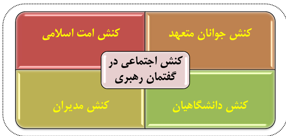
شکل شماره ۲. مؤلفه‌های بیانات رهبری در خصوص کنش اجتماعی

آیت‌الله خامنه‌ای در خصوص کنش دانشگاه‌ها و مدیران و رؤسای آن و ایجاد و تحقق تمدن نوین اسلامی اشاره دارند. ایشان نقش تاریخی دانشگاه را مهم و ارزشمند می‌دانند و درصدد توصیف نقش و کارکرد آشکار و پنهان این نهاد مدرن در جهت تمدن نوین اسلامی هستند: «ما چه کار کنیم که از این دانشگاه با این زمینه‌های تاریخی، با این میراث، با این تجربه‌ی خوب و آزمون خوبی که دانشگاه به وجود آمد. بتوانیم برای ایجاد تمدن نوین اسلامی بهره ببریم؟ هدف ایجاد یک حاکمیت اسلامی است که بتواند جامعه را به جامعه‌ی موردنظر و آرمانی اسلام تبدیل کند. ما می‌خواهیم کشور خودمان در درجه اول حالا کشورهای دیگر و مسائل بین‌المللی و جهانی را نمی‌کنیم - یک کشوری بشود که به آن خطوط آرمانی اسلام برسد که این خطوط یک چیز مطلوب و شیرینی برای هر انسان متفکری است یعنی هرکسی که بنشیند فکر کند مطالعه کند از این وضع آرمانی جامعه اسلامی لذت می‌برد. جامعه‌ای که در آن هم علم هست و هم پیشرفت هست و هم عزت هست، هم عدالت هست، هم قدرت مقابله با امواج جهانی هست، هم ثروت هست یک تصویر این‌جوری، ما به این می‌گوییم تمدن نوین اسلامی. می‌خواهیم کشورمان به اینجا برسد. دانشگاه چه نقشی می‌تواند ایفا کند و چه کار باید بکند؟ اولاً نقش‌آفرینی دانشگاه لازم است. ثانیاً